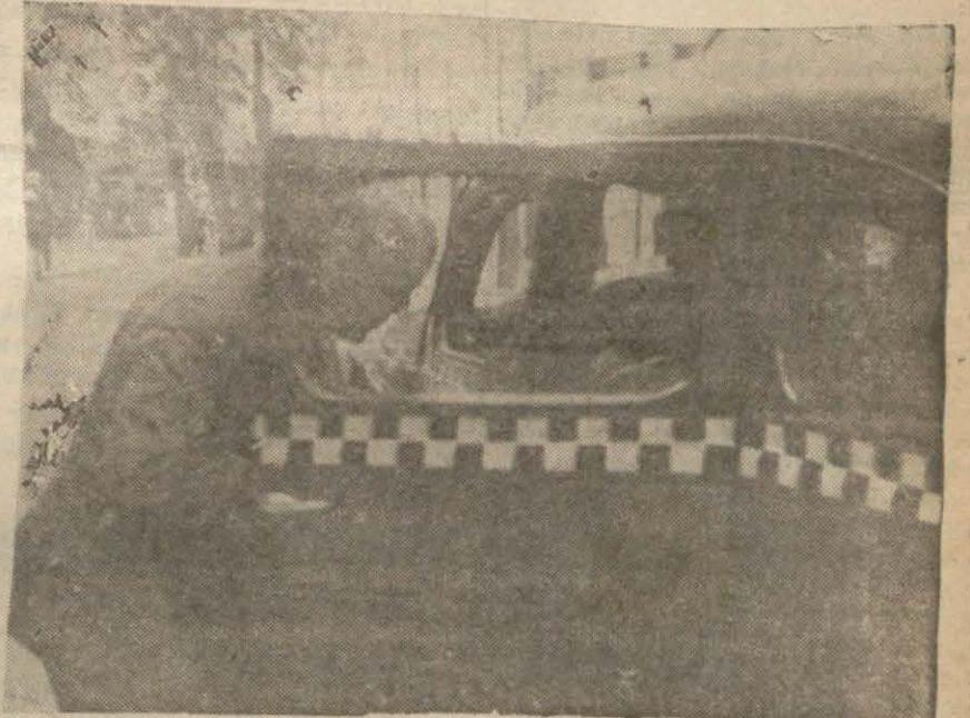
Beyker mağazası müdürü adliye dairesinden tevkifhaneye gitmek üzere otomobile binerken

Beyker müessesesi aleyhindeki kundura iddiasının müddetumu, milkeçe yapılan tahkikat sonunda mevcut delillerle sabit görülerek, asliye 2 nci ceza mahkemesine intikal ettirilmişti.