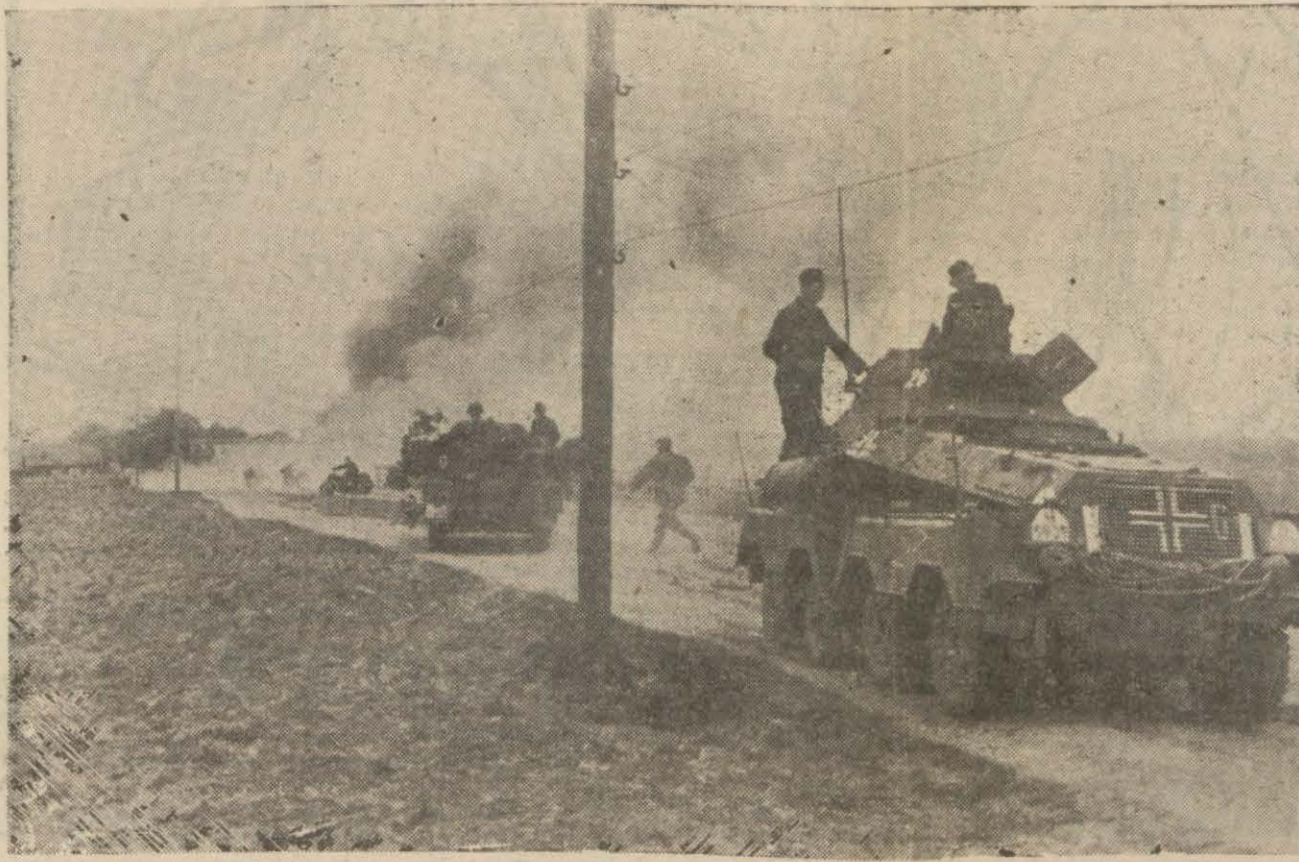
Yanan şehirlerden geçerek ilerleyen Alman tankları

Muharririn hastalığı yüzünden bir iki gündür konamayan tefrikanamızı bugünden itibaren nesre devam ediyoruz. Vaki teahhür ve inkıradan dolayı okuyucularımızdan özür dileriz.