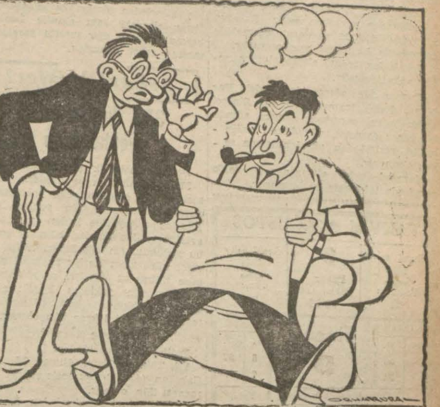
Şehir Tiyatrosu bu sene repertuarına, Avrupa tarzda başlayacaktır. Demek hep facia oynanacaktır.

Şark cephesinde harb başlayalı bugün aşağı yukarı kırk gün oluyor, bu müddet zarfında Alman piyade tümenleri hududdan itibaren birçok da muharebeler vermişlerdir. Şu halde bu tümenlerin, bugün Smolensk ile Vjasmır arasında muharebe etmekte olan Alman zirhlî ve motörlü tümenlerinin hizasına henüz vâsil olamamış, fakat gün geçtikçe buraya biraz daha yaklaşmış oldukları kendiliğinden anlaşılır. Bu hesabın bir hakikat olduğu ve buna göre önümüzdeki günler zarfında Leningrad, Moskova ve Kieff istikametinde [Devamı 3 nci sayfada]