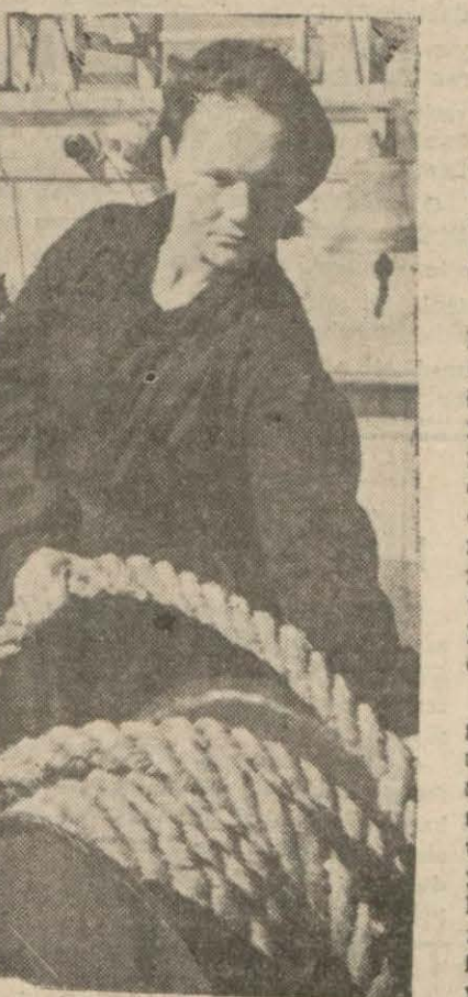
Beaz denizdeki Sovyet gemilerinde cepheye giden erkeklerin yerini alan bir genç kuş